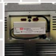
Místo pro AC měnič volitelné