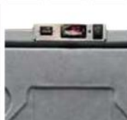
Elektrický termostat a digitální display