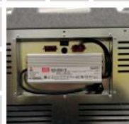
Místo pro AC měnič volitelné