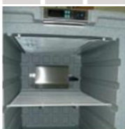
Umístění topného tělesa a ventilátoru v boxu