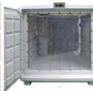
Záclonka - příslušenství