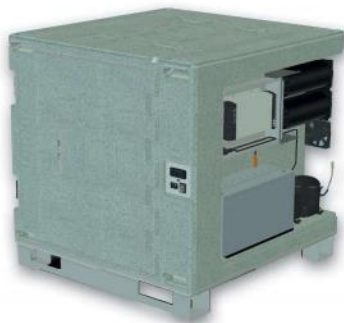
F 0330 s integrovanou baterií a nabíječkou. Kontaktujte nás pro více informací.