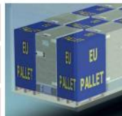
F 0760 má větší rozměry jako paleta 800x1200 mm