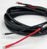
12/24V DC kabel