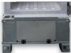
Nerezová paleta jako základna (100mm)