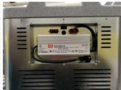
AC měnič - příslušenství