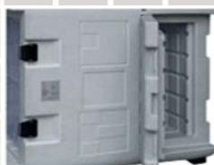
Praktická boční dvířka (F 0915), která mohou být zamčena