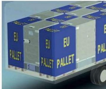
F 0760 mají vnější rozměry jako Euro palety - 800x1200mm.