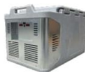
Možnost umístění napájecího zdroje