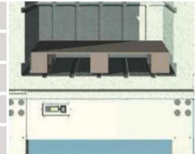
F 1640 mají vnitřní rozměry jako Euro palety - 800x1200mm