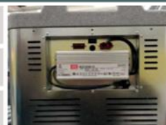
T 0052 nebo T 0082 místo pro AC měnič - volitelné