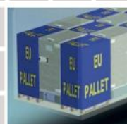
F 0760 má vnější rozměry EUR palety 800x1200mm