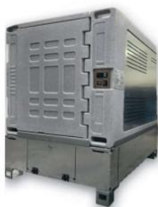
AOM řešení má paletovou základnu