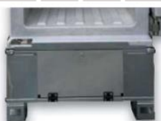
Nerezová paleta (100mm) jako základna