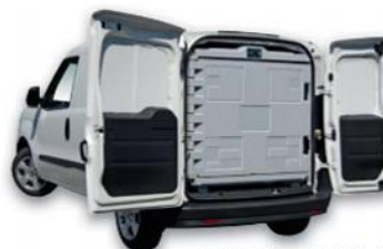
F 0915 ve Fiatu Dobló