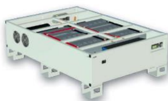
Integrovaný chladicí systém, baterie a nabíječka v paletové základně