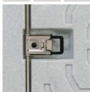
F 0720 má kování z nerezové oceli