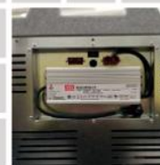
Místo pro AC měnič volitelné