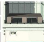
F 1640 má vnitřní rozměry jako paleta 800x1200mm