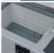
Topné těleso a ventilátor uvnitř boxu.