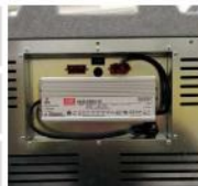
Místo pro AC měnič volitelné