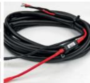
12/24V DC kabel