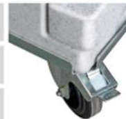
Kolečka - příslušenství