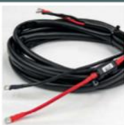
12/24V DC kabel