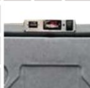
Elektrický termostat a digitální display