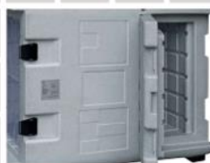
Praktická boční dvířka