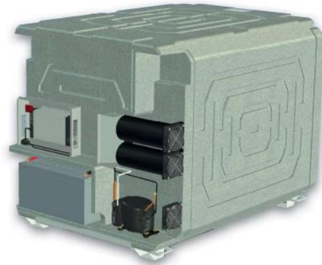
F 0720 s integrovanou baterií a nabíječkou. Kontaktujte nás pro více informací.