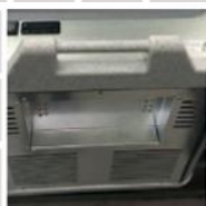
Madlo pro snadnou manipulaci