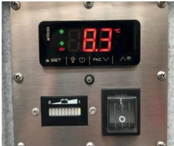
Modely AOM mají elektrické ovládání, digitální display ukazující teplotu a indikátor baterie.