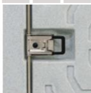
F 0720 má kování z nerezové oceli