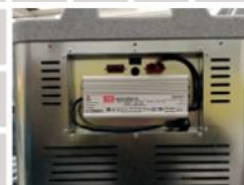
T0052 a T0082 AC napájecí zdroj (příslušenství)